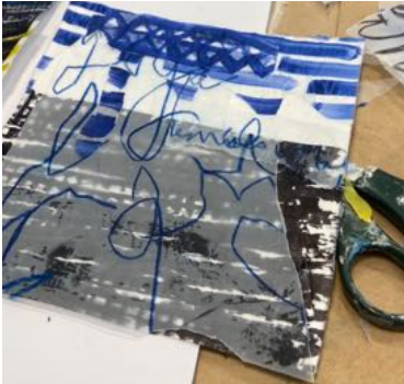
ANNETTE JELLINGHAUS COLLAGE MIT EXPERIMENTELLER ZEICHNUNG

www.stilhaus-magazin.de/workshops office@stilhaus-magazin.de