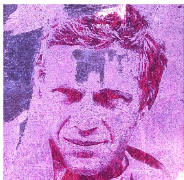
PETER HINRICHS TRANSFERLITHOGRAPHIE - Porträt im Fokus