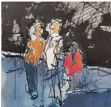
DIRK BEHRENS MISCHTECHNIKEN - Kleinformat