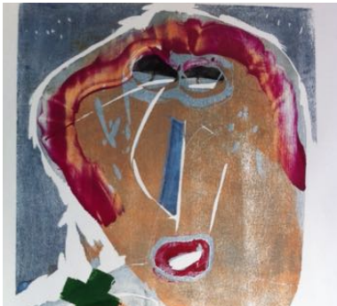
SABINE NIER HOLZSCHNITT UND DRUCKTECHNIK